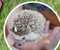
小動物のふれあい