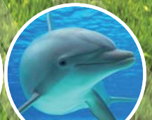
イルカ・クジラプール見学